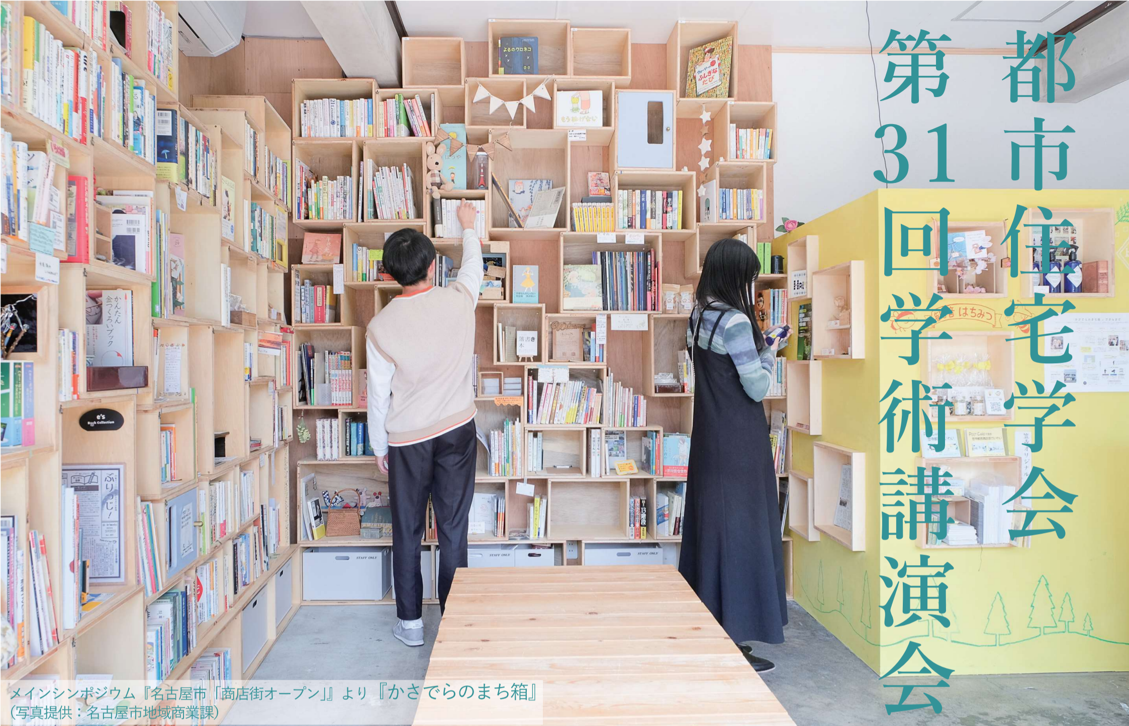
メインシンポジウム『名古屋市「商店街オープン」より『かさでのまち箱』