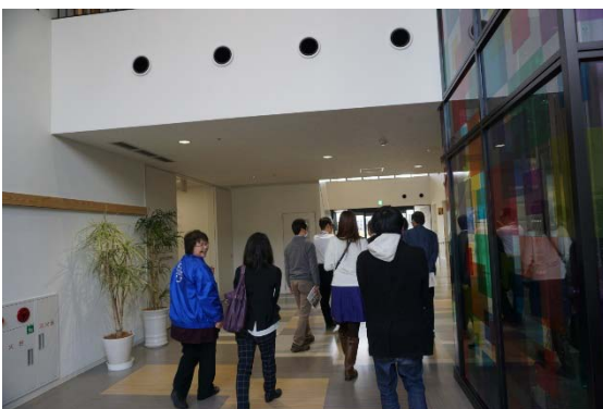
駅への通勤時に通り抜け可能