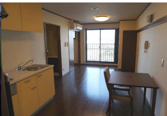
サービス付き高齢者向け住宅 居室（約25㎡）