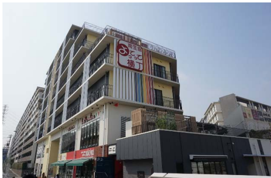
よってって横丁外観

http://www.minami-hp.jp/about/index.html