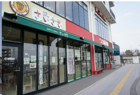
1階にはカフェやベーカリー、バーも。