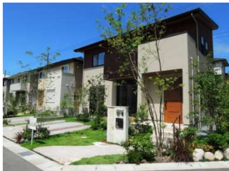
自然樹形が美しい、緑豊かな植栽計画