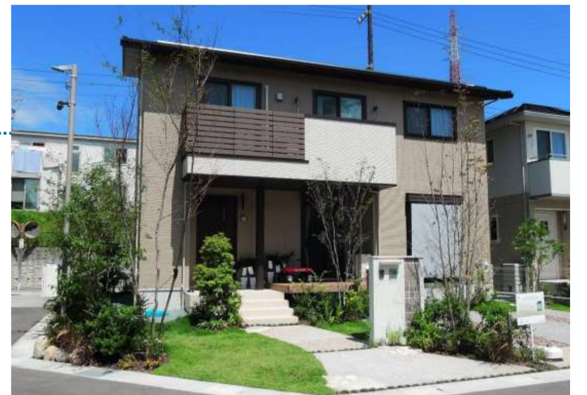
地域学習の場としても使用するモデルハウス