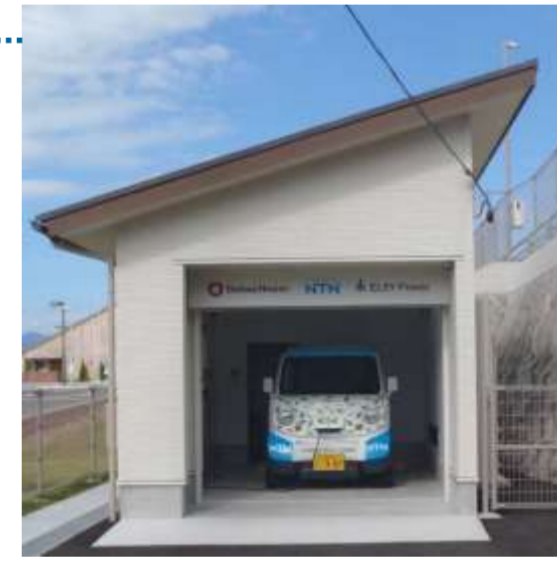
超小型モビリティ車庫として利用するスマ・エコステーション 将来は防災倉庫として活用