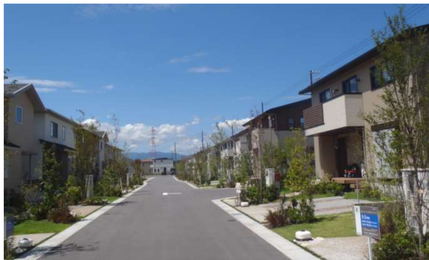
宅地に電線類を埋設して無電柱エリアを実現した街並

住民共有の街かど太陽光発電所により、街全体でネット・ゼロ・エネルギーを達成する先進的なスマートタウン。 これまでのように、単に地球環境に優しい街を作るだけではなく、そのメリットを形に変えて、タウンマネジメントを行い、生活支援サービス等としてお住いの方へ提供していく。 新しい暮らしが体験できる街が陽だまりの丘にあります。