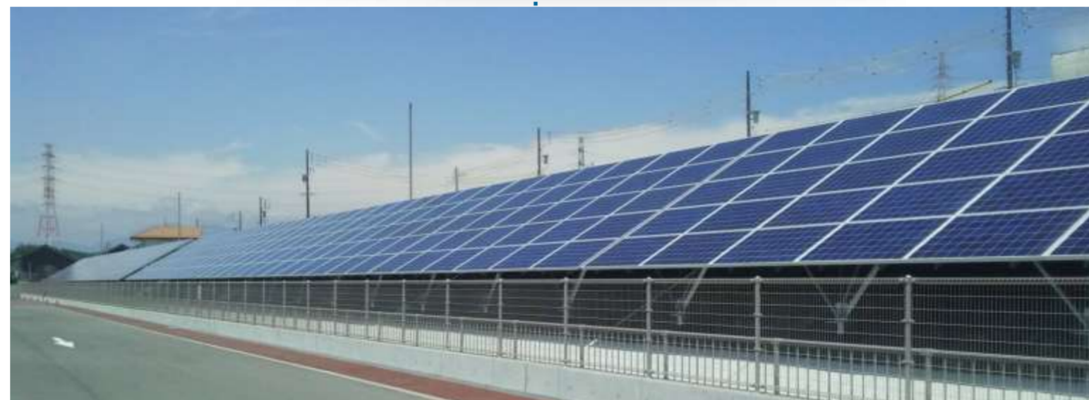
街かど太陽光発電所（合計100kW）