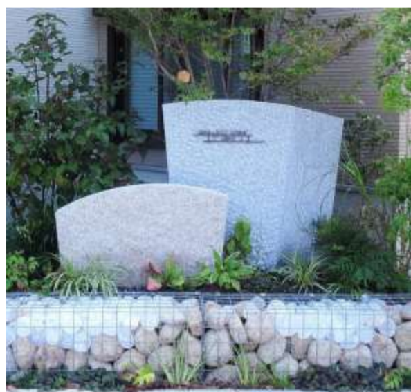
街の入口に配置したデザインウォール