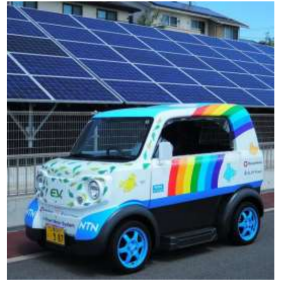
住民の移動手段の将来性を検証する超小型モビリティ