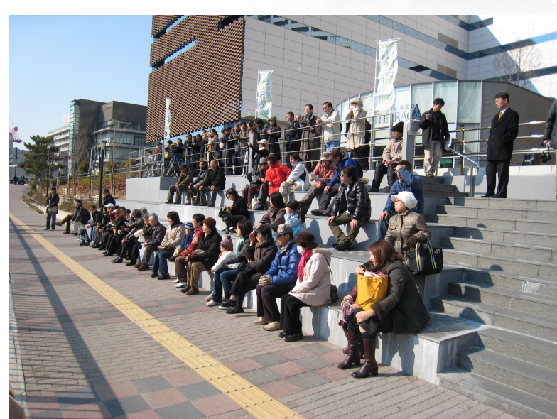
福島港のイベント時の様子