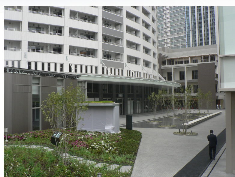
打ち水プラットフォーム