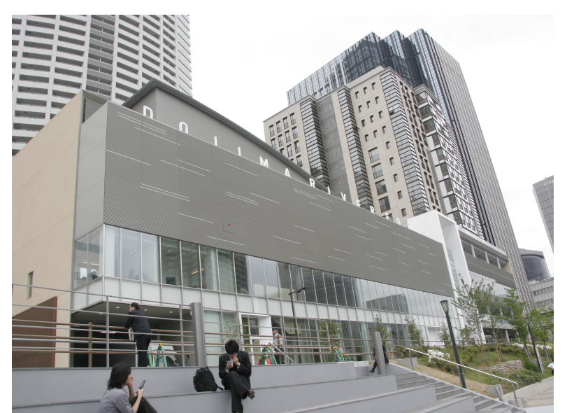
堂島リバーフォーラム